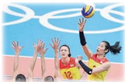
中国女排赛场拼搏

中国女排是在世界体坛上不断创造奇迹的一支劲旅。20世纪80年代实现“五连冠”的中国女排，在2016年里约奥运会上又以荡气回肠的完美逆袭，为祖国赢得一枚弥足珍贵的金牌。多年来，中国女排以高昂的斗志、顽强的作风、精湛的技艺，不断诠释着无私奉献、团结协作、艰苦创业、自强不息的女排精神。