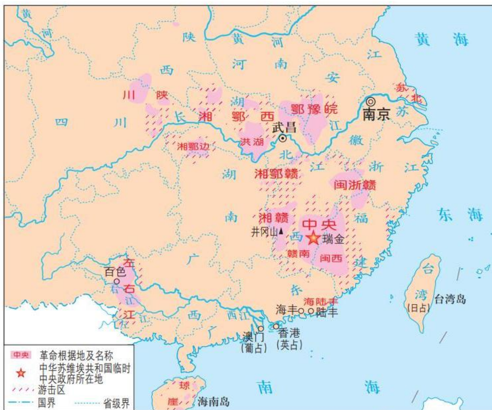
1929—1932年农村革命根据地分布示意图