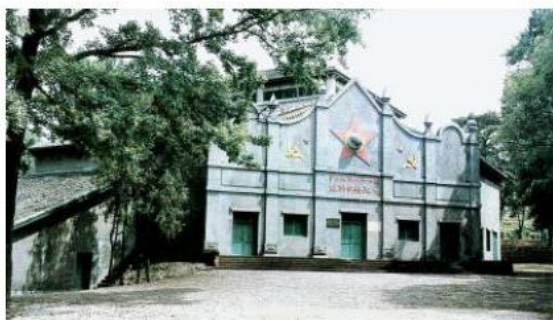
瑞金临时中央政府大礼堂

1931年冬，中华苏维埃第一次全国代表大会在江西瑞金召开。会议宣布成立中华苏维埃共和国临时中央政府，定都瑞金，毛泽东当选为中央执行委员会主席和中央执行委员会人民委员会主席。