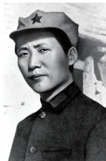
长征到达陕北后的毛泽东