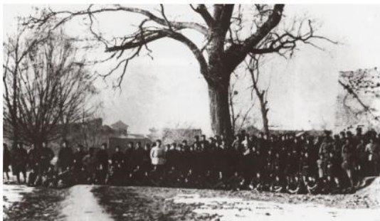
红一方面军到达陕北吴起镇部分将士留影

红军长征的胜利，粉碎了国民党反动派消灭红军的企图，保存了党和红军的基干力量，使中国革命转危为安。红军长征播下了革命种子，铸就了长征精神，打开了中国革命的新局面。