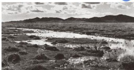
红军走过的水草地