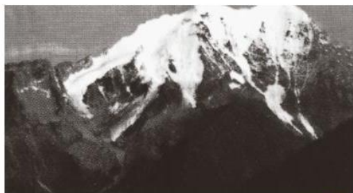
红军翻过的第一座大雪山——夹金山

遵义会议后，红军经过整编，提高了战斗力。毛泽东指挥红军，声东击西，四渡赤水，佯攻贵阳，打乱了敌人的“追剿”计划。然后挥师北进，渡过金沙江，跳出了敌人的重重包围。短暂休整后，红军继续北上，强渡大渡河，飞夺泸定桥，翻过了高耸入云、人迹罕至的大雪山，走过了遍布沼泽、杳无人烟的茫茫草地，突破敌人重兵把守的天险腊子口，进入甘肃。